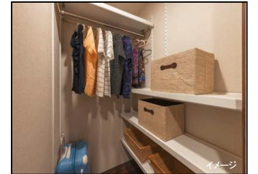
大容量 ファミリー収納